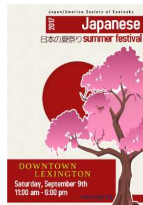
↑ 2017 年度ポスター