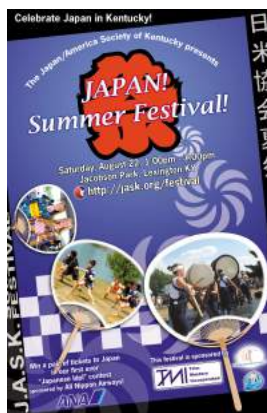
↓ 2009 年度ポスター