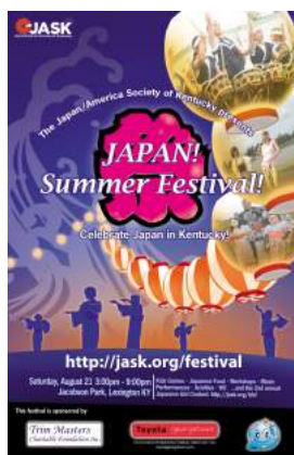
↑ 2010 年度ポスター